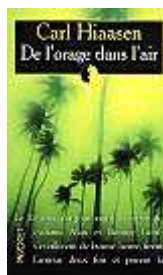
De l'orage dans l'air Carl Hiaasen

Californie, 2025 : l'effet de serre, les pluies acides et les épidémies ont fait disparaître les principaux mammifères et ont ravagé la planète. Ty Tierwater, 76 ans, responsable d'une ménagerie d'animaux en voie d'extinction va se rappeler ses années de militantisme au sein de l'association La Terre pour Toujours, alors que son ex-femme réapparaît dans sa vie.