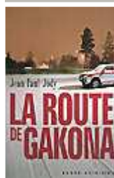
La route de Gakona : roman noir Jean-Paul Jody