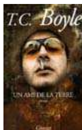
Un ami de la Terre T. Coraghessan Boyle

Les romanciers racontent les changements climatiques sur la planète