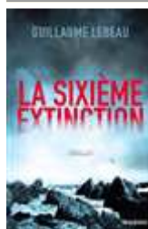
La sixième extinction Guillaume Lebeau

Au coeur de la tempête qui dévaste La Nouvelle-Orléans, dans un saisissant décor d'apocalypse, quelques personnages affrontent la fureur des éléments, mais aussi leur propre nuit intérieure.