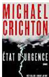
État d'urgence Michael Crichton

Un ouragan qui dévaste les environs de Palm Beach a toutes les chances d'attirer les charognards. En tête, toujours partante pour un mauvais coup, Edie Marsh, jeune femme sans scrupules ; sur ses talons, Lester Maddox Parsons, alias The Snapper, un meurtrier et, fermant la marche, Avila, un ancien inspecteur des bâtiments véreux. Leur route croise celle de Max et Bonnie, de jeunes mariés.