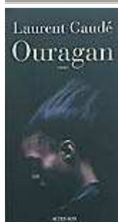
Ouragan Laurent Gaudé

Malgré tous les efforts des services secrets français et américains, Kinscoff enquête sur un brevet en rapport avec la mise au point d'armes climatiques. A Gakona, en Alaska, il découvre l'existence du programme Haarp sur l'utilisation de l'énergie des aurores boréales pour modifier le climat.