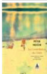
La constellation du chien Peter Heller

Dans cette enquête qui les mènera aux quatre coins du monde, Smila et Ethan vont tenter de déjouer la deuxième phase du complot fomenté par le Troisième pôle qui consiste à faire exploser la base où se réunissent les plus éminents spécialistes du climat.